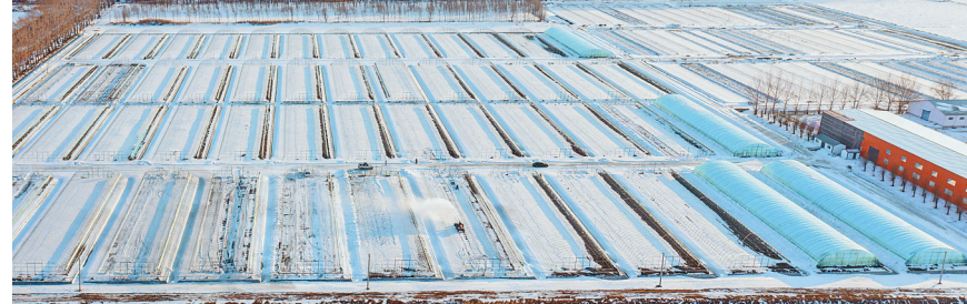
友谊分公司水稻种植户清理大棚内的积雪。