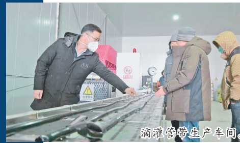
滴灌管带生产车间。