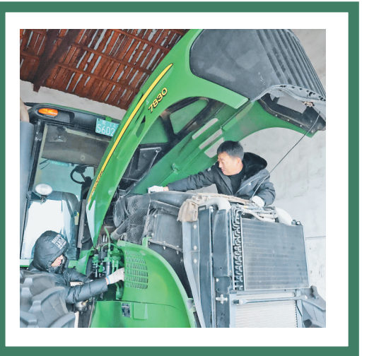
↓检修农机。