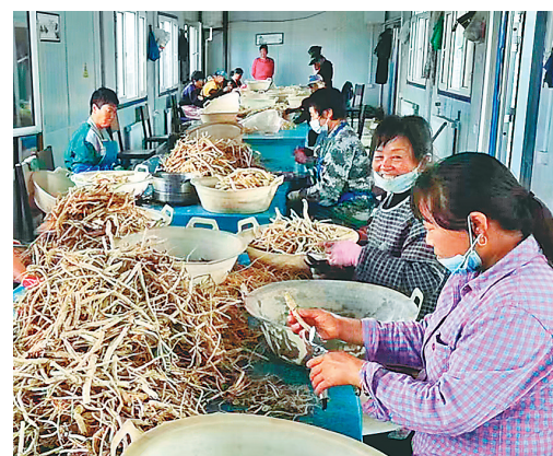
□文/刘显涛 记者白云峰

2022年,方正县会发镇以“能力作风建设年”为契机,转作风、提能力、抓重点、促发展,围绕“一个核心引领”即基层党建质量提升年暨“15151”工程,抓好稻米和北药两大重点产业,提升服务、攻坚、治理三项服务能力,形成了聚焦发力、以上率下、整体联动的工作新格局,唱响乡村振兴“四部曲”。 强化顶层设计,谱写产业发展“畅想曲”。会发镇着力打造党建升级版,启动实施基层党建“15151”工程。开展承诺践诺以及书记述职评议活动10余次,开展党员献爱心以及志愿服务活动50余次,开展党员民主评议活动15余次,开展党员微党课、知识竞赛等活动40余次,党组织引领作用不断增强。 强化产业融合,谱写产业发展“协奏曲”。重点抓稻米和北药两项重点产业。在稻米产业方面,新增2家规模以上稻米加工企业,年加工能力达到40万吨;在北药产业方面,新增种植面积890亩,全镇种植面积达到8350亩,发展中药材种植专业合作社4家。借助全省中药材产业示范镇建设契机,积极推进1家扩建、2家新建中药材初加工项目建设,建成后年可加工中药材1500吨,产值2900万元。 强化深入服务,谱写能力提升“进行曲”。服务能力不断提升,引进哈尔滨远洋热力公司投资2000万元建设新能源集中供热项目,切实解决供热成本高、温度不达标等问题;主动应对春季农户水稻秧苗病害突发状况,镇村两级积极帮助农户购买秧苗,保证不误农时、不误春耕;借助富硒稻米和牛产业项目签约契机,主动寻找合适地源,逐户做好宣传动员,确保2200亩项目用地按时到位,为项目落地打下坚实基础;完善生活垃圾收运治理体系,完成改厕3669户。在会发镇沿线4个屯栽植5.7万株百合,打造2.1公里百合大道,一次栽植多年受益,实现经济价值和社会效益“双丰收”。 强化领导责任,谱写作风转变“引导曲”。工作作风转变,开设廉政教育“清风课堂”,坚持“每月一案、每季一课”,教育广大干部勇于担当;服务能力转变,与2家企业联合开展“浓情端午”爱心企业慰问贫困户活动,向15户困难家庭捐款15000元慰问金;工作机制转变,实行周例会、月调度、季汇报、半年拉练检查、年终总结评比的机制。会发镇乡村振兴服务中心荣获哈尔滨市第38届“劳动模范集体”称号。 筛选药材。