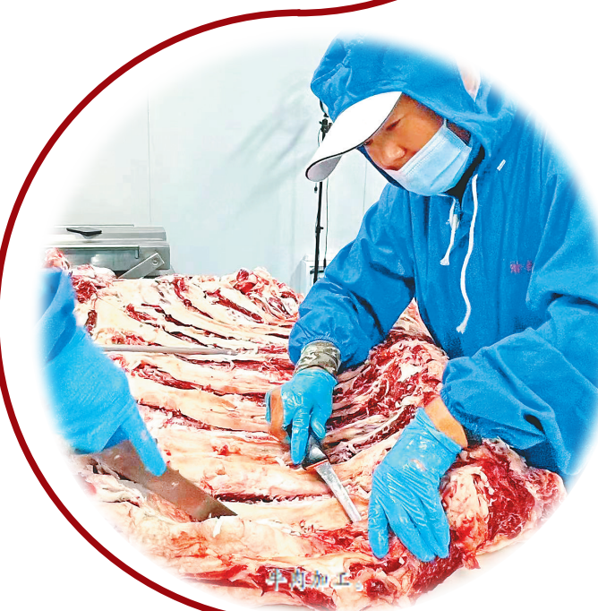
□文/张可新 刘婧婧 本报记者 白云峰

不负春光“开好局”,拼抢元年“开门红”。2月2日,宾县九安牲畜交易中心迎来春节后的首个牛市交易日。来自省内外的牛商齐聚于此,400多头牛进场交易,成交率达到100%,新春首场牛市实现了“开门红”。 清晨,位于常安镇的九安牲畜交易中心已热闹起来。交易场内,“哗哗”声不断,一头头体格健壮的黄牛一字排开,牛商们细细打量和评价着心仪的黄牛。“交易中心有便利的交通环境,优质的配套服务,成为省内外牛商的集聚地。”来自依兰县的养殖户孙忠臣说,他16岁开始和牛打交道,自从有了九安牲畜交易中心,他就是这里最大的牛商之一。 来自依兰县的养殖户刘井海,穿梭在各个棚圈内选择中意的黄牛。“在这里交易,不仅有黄牛体检医生把关黄牛健康,还有公平秤保