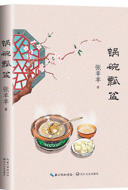
《锅碗瓢盆》 张羊羊 著 长江文艺出版社 2022年9月

该书为《文学之都·青柠檬丛书》之一,收录第七届“青春文学奖”获奖的5部中短篇小说,在一定程度上表现了当代大学生的创作面貌。