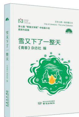
《雪又下了一整天——第七届“青春文学奖”中短篇小说获奖作品集》 《青春》杂志社 南京文艺出版社 2022年9月

是作者近年为《人物》等专栏撰写的影评剧评汇集的随笔杂文集。在她的笔下,那些经过岁月淘洗的令人难忘的文艺作品,不仅仅是记录当代社会发展进程的影像文本,更是构成我们生活的一部分。