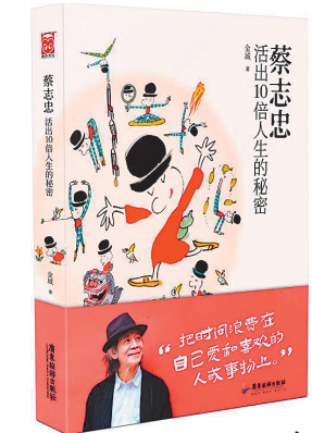
《蔡志忠——活出10倍人生的秘密》/金城/广东旅游出版社/2022年11月