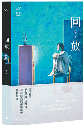
《回放》 叶三 著 漓江出版社 2022年9月

是作者近年为《人物》等专栏撰写的影评剧评汇集的随笔杂文集。在她的笔下,那些经过岁月淘洗的令人难忘的文艺作品,不仅仅是记录当代社会发展进程的影像文本,更是构成我们生活的一部分。