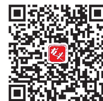
详细内容请扫码了解