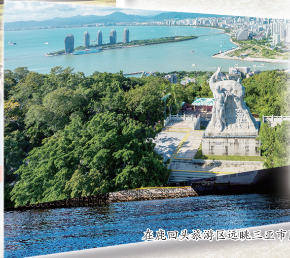
在鹿回头旅游区远眺三亚市区美景。