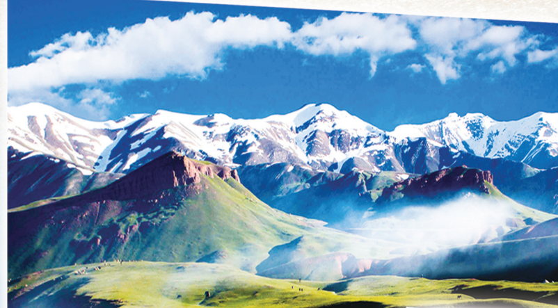
乌恰县玉其塔什草原。