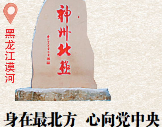
身在最北方 心向党中央

泱泱神州,浩浩中华。今年全国两会召开在即,黑龙江日报报业集团发起,联合海南日报报业集团、新疆日报报业集团推出融媒报道“神州四方 青春绽放”,身处祖国四方的年轻人,畅谈过去一年的获得感,展望今年的奋斗目标,用行动诠释青年一代的责任与担当。