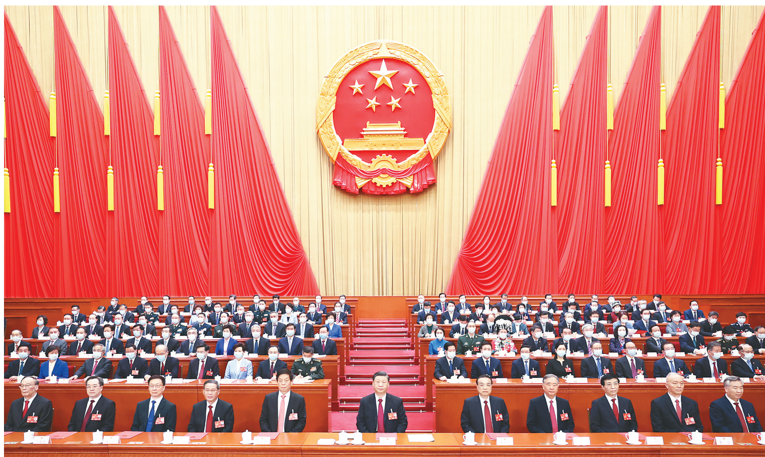
3月13日,第十四届全国人民代表大会第一次会议在北京人民大会堂闭幕。中共中央总书记、国家主席、中央军委主席习近平发表重要讲话。