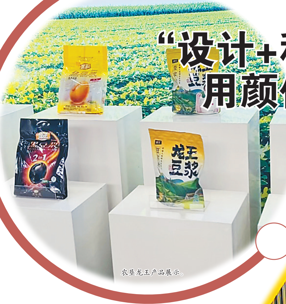
农垦龙王产品展示。

近日,2023年工业设计服务市地行首站走进绥化。省工信厅工作人员、深圳市工业设计行业协会的专家们一起实地走访了绥化企业,开启了龙江工业设计服务之旅,现场为企业解锁工业设计赋能的密码。