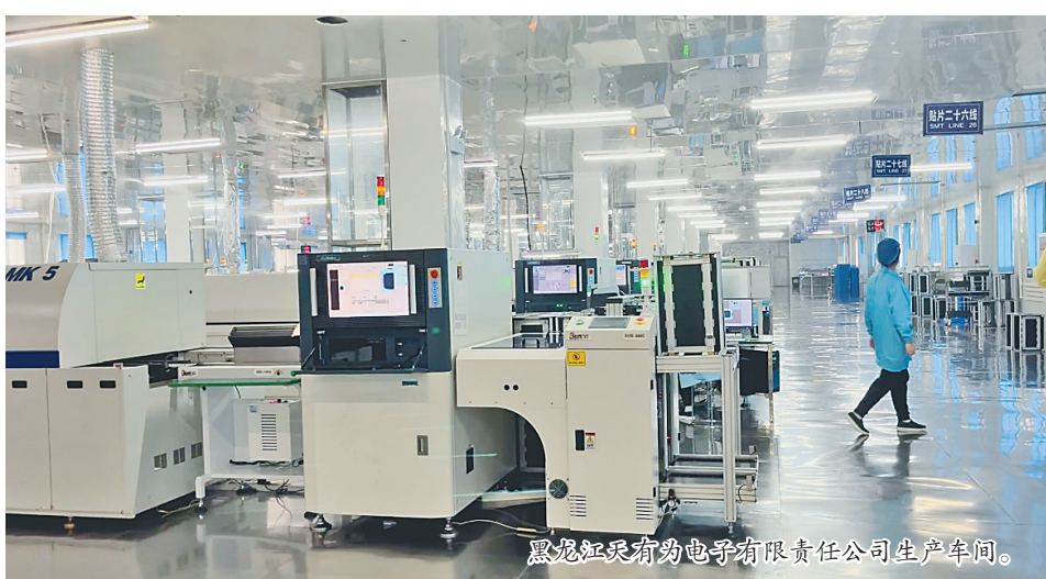
黑龙江贝特佳营养食品有限公司生产车间。

省工信厅工作人员、深圳市工业设计行业协会的专家们一起实地走访了绥化企业,开启了龙江工业设计服务之旅,现场为企业解锁工业设计赋能的密码。