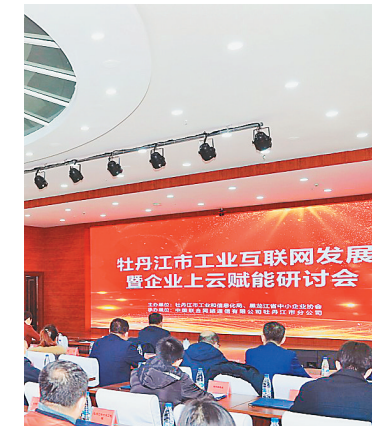
研讨会现场。

现场对接合作氛围热烈,对接成果颇丰。穆棱市联通分公司与穆棱市鑫锐亚麻纺织有限公司签订企业上云合作协议。