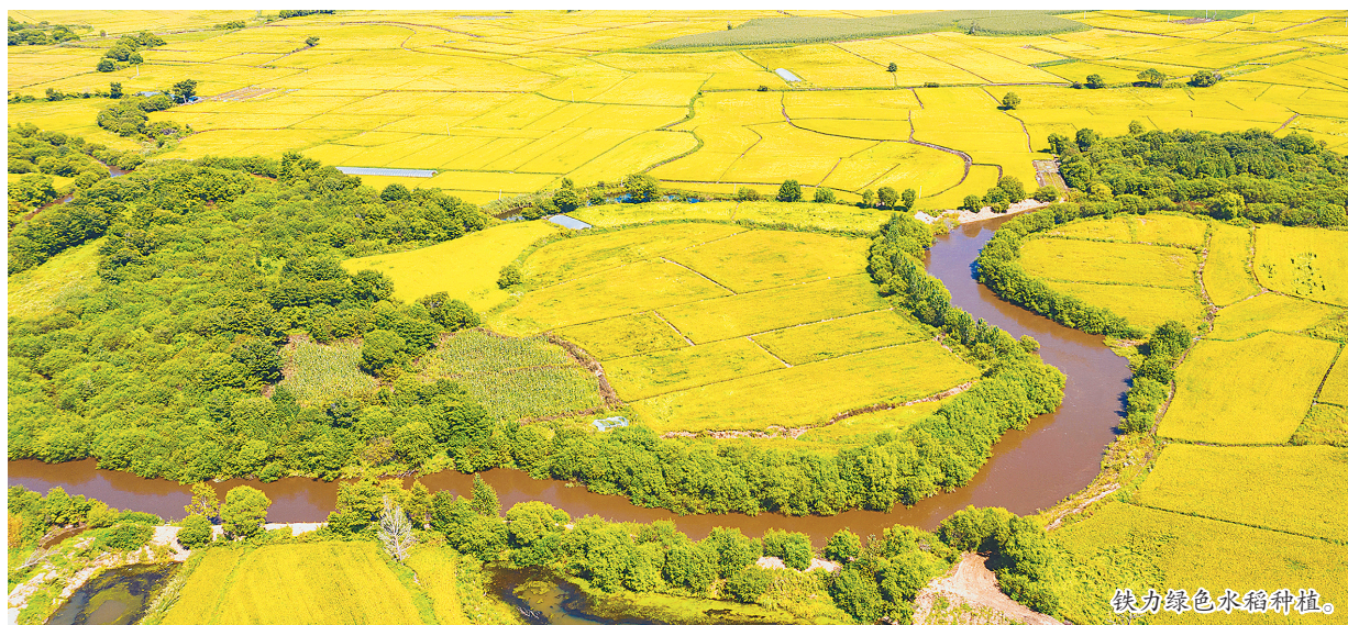
铁力绿色水稻种植。

接下来,伊春市将聚焦建设“四个基地”,即建设生态森林食品供应基地、冷水鱼产品生产供应基地、寒地果蔬生产基地和生物产业基地,在保障粮食安全供给前提下,进一步扩大食物来源、增加食物总量。