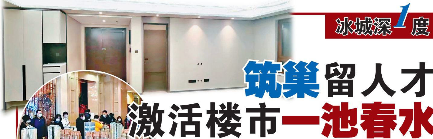
文轩科技创新园人才公寓样板间一角。

3月27日,申办准入新标准在哈市市场监管局申办审批窗口正式实施。企业申办体外诊断试剂经营许可,质量负责人专业要求由单一检验学专业放宽至生物医学工程、生物化学、免疫学、基因学、药学生物技术、临床医学、医疗器械等相关专业,学历要求由大学本科以上降低到大专学历以上。