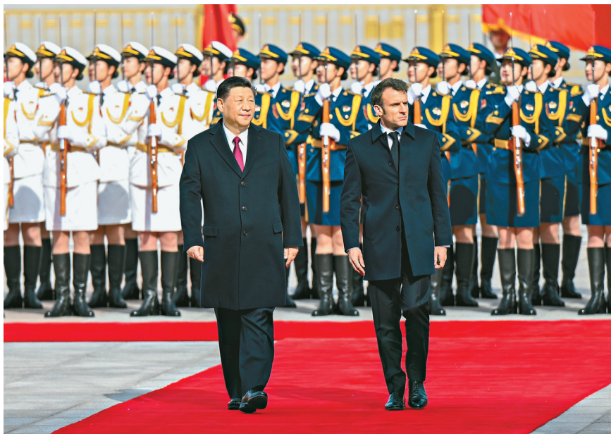
4月6日下午，国家主席习近平在北京人民大会堂同来华进行国事访问的法国总统马克龙举行会谈。