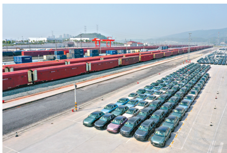
4月10日,商品车在重庆鱼嘴站等待装车(无人机照片)。

我国已有多条技术路线新冠病毒疫苗陆续获批使用。研究结果显示,序贯免疫能够为个体提供更全面的保护。