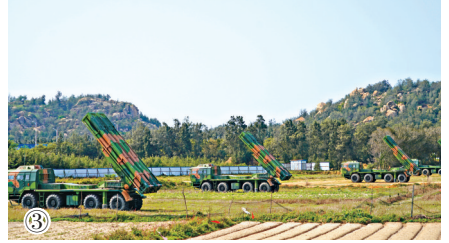
①这是歼-15舰载机从海军山东舰起飞升空。 ②这是歼击机挂载起飞。 ③这是东部战区陆军某地兵旅在对台岛及周边海域关键目标实施模拟精确打击。