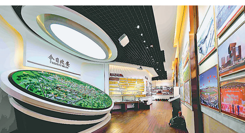
李炳顺 本报记者 邵晶岩

去年以来,北安市以实施省委旧址保护利用和周边环境美化项目为契机,对全市红色场馆进行数字化改造升级,积极推进创意设计产业发展,创新打造“创意设计+”新模式,通过创意设计,多元呈现红色文化内核,有效推动红色文化产业繁荣发展。