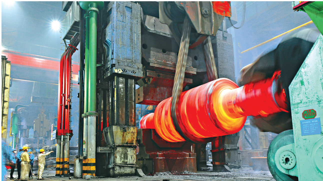
装备获国务院国资委“专精特新”示范企业荣誉称号。

本报讯(米迎新 记者孙昊)年初以来,中国一重集团深入贯彻党的二十大的全国两会精神,不断在改革管理、科技创新、市场开拓、产业发展、党的建设等方面下功夫,高质量完成了各项预算目标。一季度,中国一重集团营业收入、利润总额、生效订单等经济指标全面增长,其中,营业收入同比增长8.62%,利润总额同比增长10.27%,顺利实现了“首季满堂红”目标。 中国一重以深化改革为动力,力争夺秒推进国家重点项目,昌江3#压力容器、太平岭1#稳压器、青岛一汽2400吨压力机、南汽5000吨热模锻、安阳钢铁3500毫米支承销等一大批重点项目顺利投产。河北美富渣1450毫米、赤峰远联二期850毫米、内蒙古8000吨热模锻等机组现场热负荷试车成功。 今年一季度,中国一重市场开拓和产业发展取得较好成效。核电、电站铸锻件新增订单同比增长,冶金装备市场保持平稳,成功签订河南鑫金汇1780毫米热连轧工程总包、永锋钢铁2250毫米热连轧机电液成套合同等一批标志性订单。同时,锻压装备成功中标比亚迪6条热模锻整线集成项目,客户群体由主机厂向一级配套商延伸。 一季度,中国一重新立项科研项目29项,“1+8”宽幅不锈钢热轧生产线工艺配置,实现自主设计开发与绿色化应用示范,整体达到国际先进水平。专项