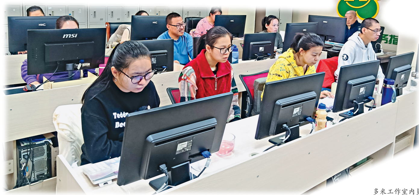
多米工作室员工们认真工作。