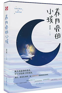
《养月亮的小孩》/ 李学武 著 时代文艺出版社 2023年1月

在很远很远的地方,有一个月亮村。那里的人昼伏夜出,以月为生。太阳世界的小女孩月囡通过水月间的联结闯入月亮村,自此展开一段充满想象力的、奇幻的冒险之旅。