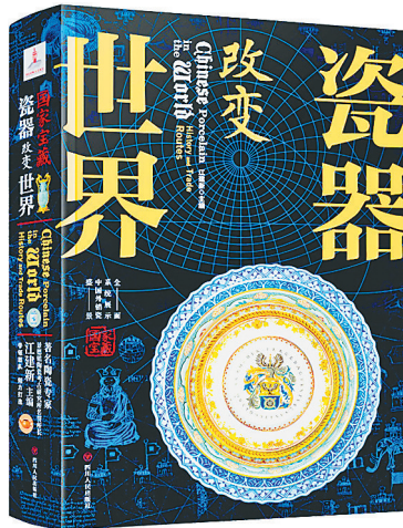
四川人民出版社/2022年12月

《瓷器改变世界》一书通过梳理中国瓷器被模仿、复制的过程,展现了中国瓷器的世界影响力和对世界文明进程的推动力。在“中国瓷器引领的世界瓷器潮流”一章中,作者指出,中国瓷器的外销,同时带动了制瓷技术的传播与交流,在世界各国迅速掀起一股中国瓷器热。