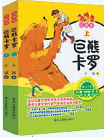
《巨熊卡罗》/ 左泓著 阿达绘/ 黑龙江教育出版社/2021年8月

保护生态环境,实现可持续发展,应当从每个人做起,希望大家人人提高环保意识,人人树立可持续发展的观念,保护好野生动物,保护好我们的家园。