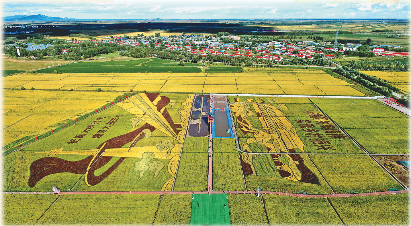
同江市三村镇二村村乡村旅游多彩稻田画艺术景观。