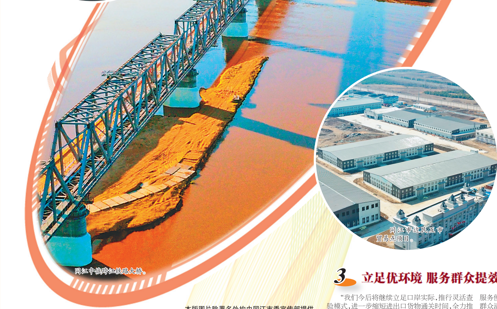
同江中俄跨境铁路大桥。