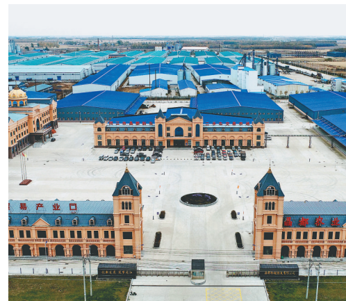
晶都冷链物流有限公司。

浩渺行无极,扬帆但信风。同江正以奋发有为的精神状态,创造性地抓好各项任务落实,怀揣着力量与信心,朝着既定目标阔步前进。