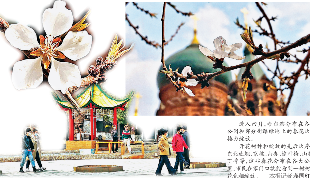
进入四月,哈尔滨分布在各大公园和部分街路绿地上的春花次第绽放。