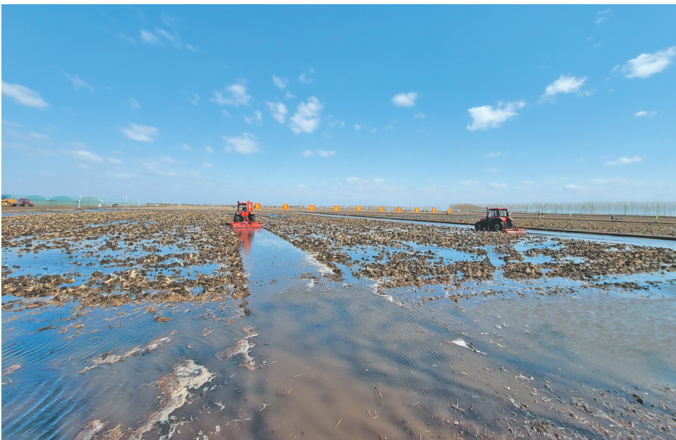
搅浆平地机正在作业。