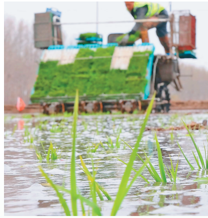
北大荒集团齐齐哈尔分公司泰来农场1万亩有机水稻率先开始插秧作业。