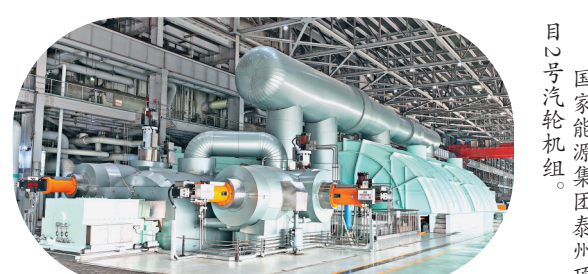
目心号汽轮机组。 国家能源集团泰州项

质量形势平稳向好。哈电汽轮机深化供方管理与招标采购专项治理,制定实施2023年供应链建设专项提升工作方案,持续引入优质供方,优化供方队伍,扎实推动供应链建设工作走深走实。今年一季度,公司参建的国能锦界“世界首例高位布置”三期扩建工程获评“国家优质工程金奖”,公司总承包的国家能源集团江苏泰州发电有限公司2号机组三改联动效能领先,产品质量形势平稳向好。