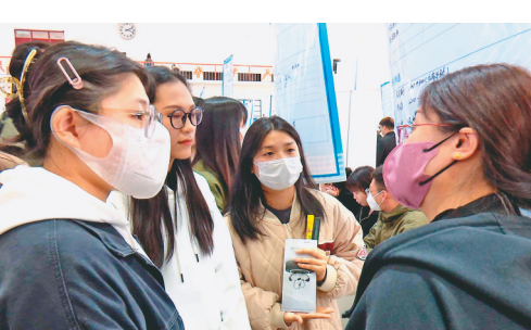
热切交流。

本报(记者刘莉 李爱民)“最是春风解人意”,眼下,大学生就业择业进入“黄金期”。近日,哈尔滨科学技术职业学院邀请哈尔滨市委组织部、哈尔滨市人力资源和社会保障局、哈尔滨市阿城区人力资源和社会保障局、黑龙江省企业发展促进会、向前大学生就业服务平台等共同举办哈尔滨科学技术职业学院2023届毕业生“政企进校园”春季招聘会。