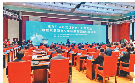
黑龙江省科技成果转化招商大会现场。

隆基绿能光伏发电项目是近期我省科技招商的重要成果之一。连日来,从牡丹江到东莞,从佳木斯到深圳,黑龙江科技招商如火如荼开展起来,丰富的科教资源、深厚的创新底蕴以及国家农高区等一系列“金字招牌”,正释放出科技招商的强大引力。