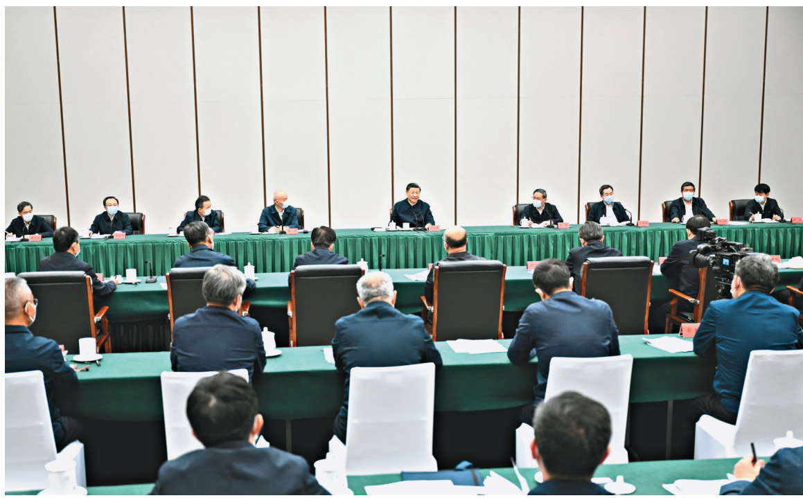
5月10日，中共中央总书记、国家主席、中央军委主席习近平在河北省雄安新区考察，并主持召开高标准高质量推进雄安新区建设座谈会。这是10日下午，习近平主持召开高标准高质量推进雄安新区建设座谈会并发表重要讲话。

习近平随后乘车来到容东片区南文营社区。该社区安置了安新、容城两县回迁群众5000多人。习近平先后来到党群服务中心和社区食堂，同社区工作人员、现场办事群众、就餐的社区老人等亲