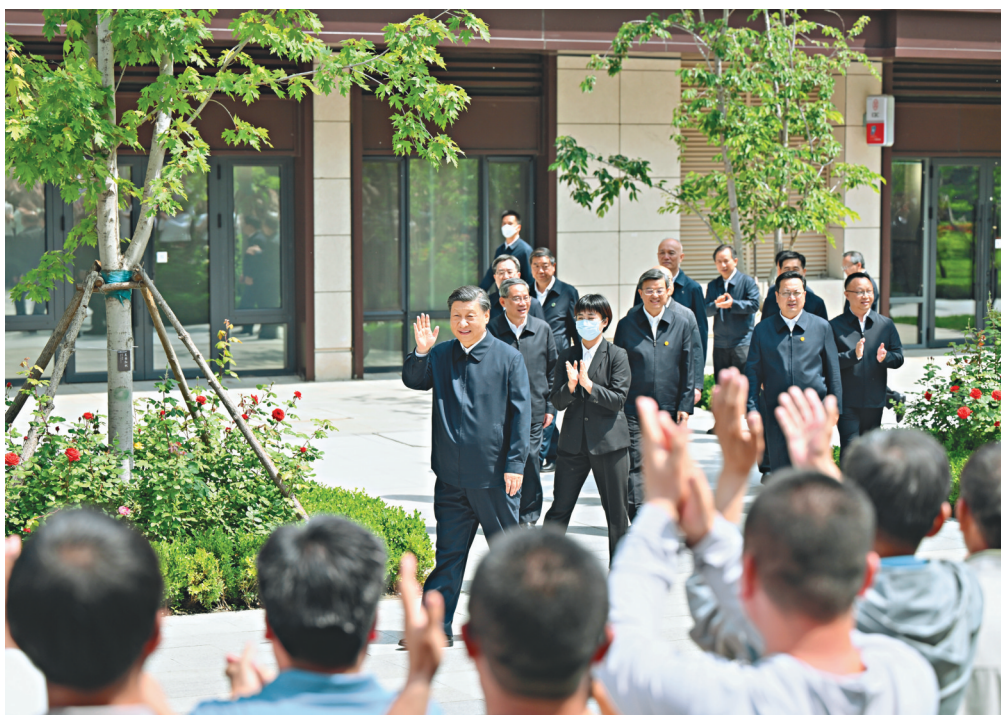
5月10日，中共中央总书记、国家主席、中央军委主席习近平在河北省雄安新区考察，并主持召开高标准高质量推进雄安新区建设座谈会。这是10日上午，习近平在容东片区南文营社区考察时向社区居民挥手致意。

切交流，仔细查看民情台账，对社区开展的便民养老服务表示肯定。习近平强调，我一直牵挂着回迁群众，看到大家生活好，我很欣慰。建设好雄安新区，重要的是衔接好安居和乐业，让群众住得稳、过得安、有奔头。要同步推进城市治理现代化，从一开始就下好“绣花”功夫，积极推进基本公共服务均等化，构筑新时代宜业宜居的“人民之城”。