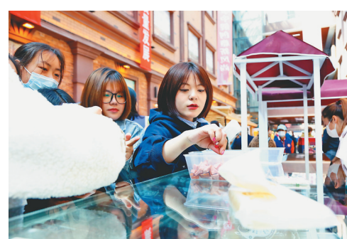
参会人员品尝特色美食。

本报10日讯(战玉杰 记者邵晶岩)为进一步推动黑河市创意设计产业高质量发展,10日,“世界的黑河”创意艺术展暨特色产品展销会在黑河市开幕。