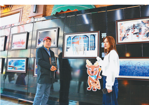
获奖者与作品合影。