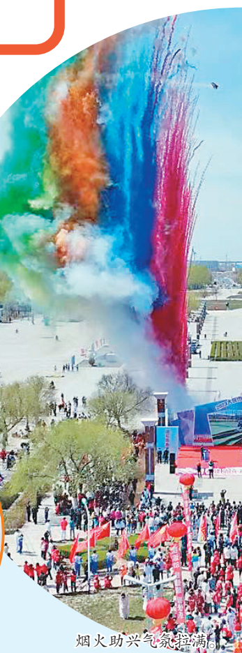
烟火助兴气氛高涨。