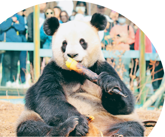
亚布力熊猫馆里大熊猫憨态可掬。