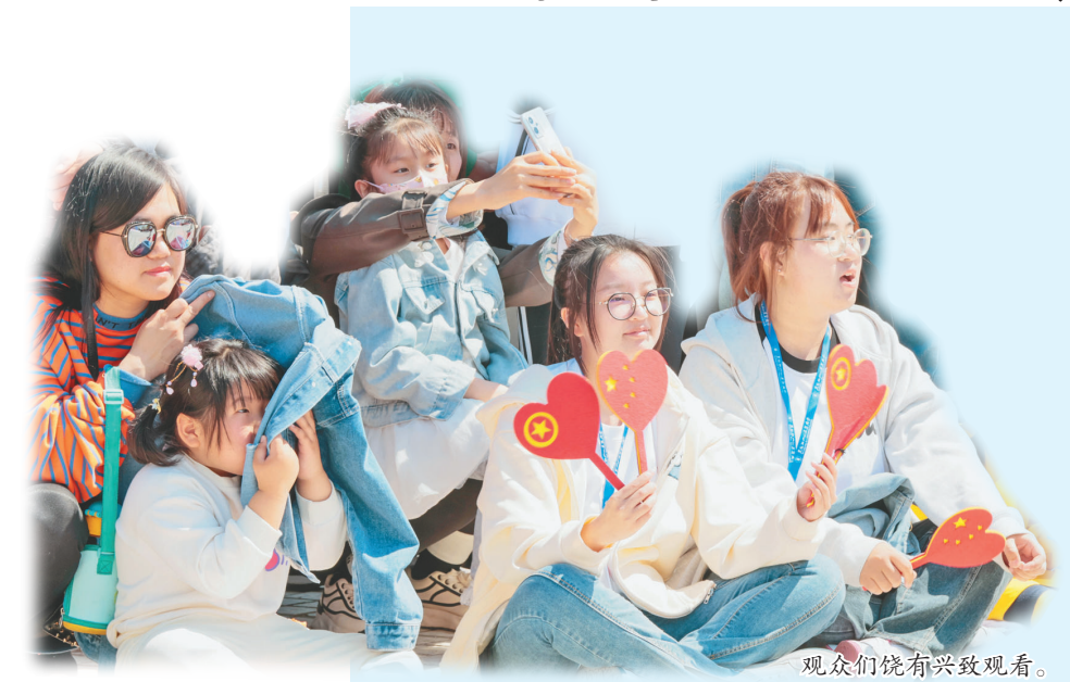
观众们饶有兴致观看。

5月7日,2023年大庆市大学生(青年)体育文创系列活动启动仪式在时代广场举行。