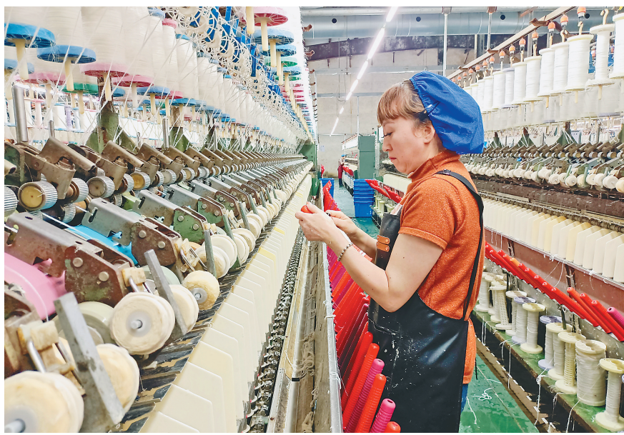
天恒麻纺生产车间。