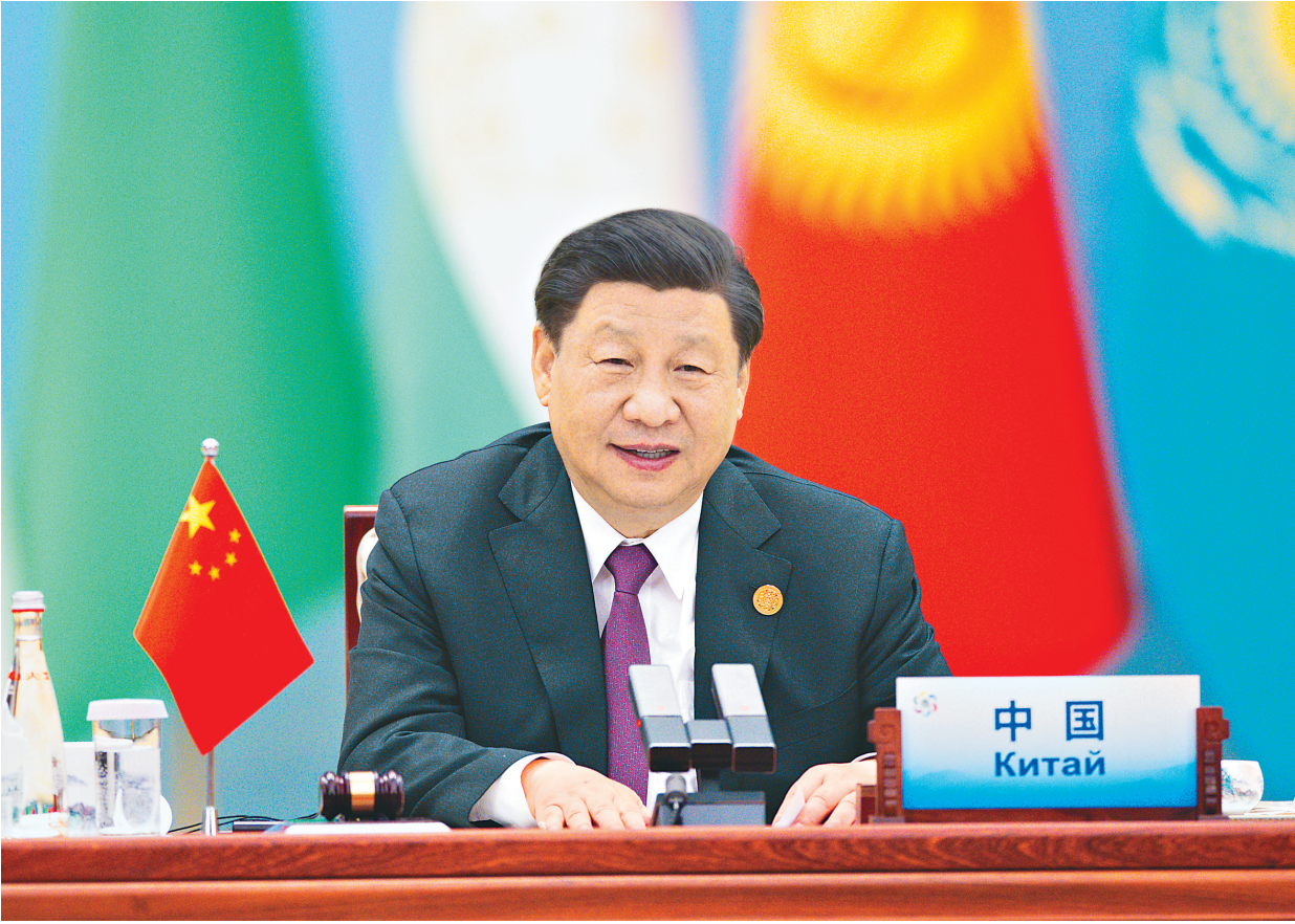
5月19日上午,国家主席习近平在陕西省西安市主持首届中国—中亚峰会并发表题为《携手建设守望相助、共同发展、普遍安全、世代友好的中国—中亚命运共同体》的主旨讲话。