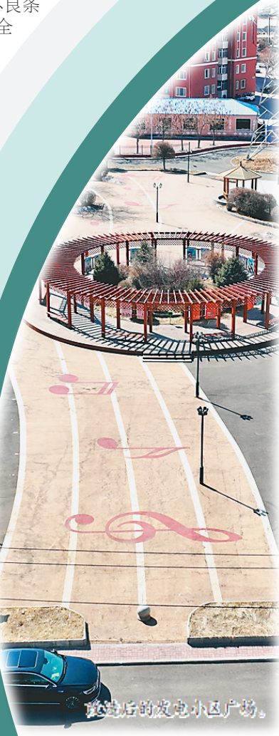
改造后的发电小区广场。

坚持机制创新,强化经营主体培育。 全区现有从事水稻制种的农民专业合作社66家、家庭农场20家,被评为省级农民专业合作社6家、家庭农场13家,实现水稻原种标准化规模化生产。构建了“农科院+种子繁育基地(种业企业)+农民”的新型农业经营主体合作模式,推动涉农企业与农户供应合作关系更加紧密。以“三区人才”“新品种展示”和“新技术示范”等科研项目为带动,针对水稻生产中可能出现的不良条件、不利因素,开展全方面技术服务,加快培育高质量的水稻品种,持续巩固现代种业发展优势。