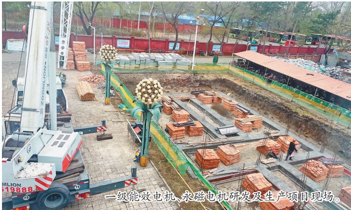
一级能效电机、永磁电机研发及生产项目现场。

中转站,每天大概130多人进场施工。这个属于续建工程,预计8月份完成主体施工。”