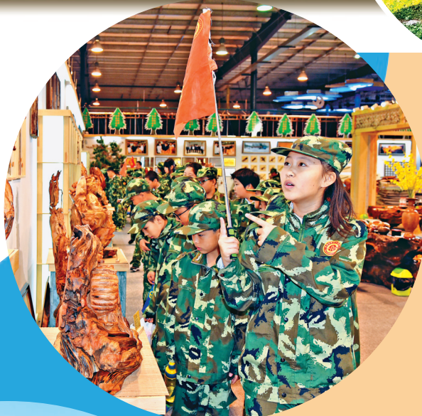
“永达”木艺研学游红红火火。

哈洽会期间,伊春市将组织翠花集团、北货郎公司、嘉荫县森嘉木业公司、伊春北方水泥公司、伊春丰林山特产品公司、伊春森工问鼎贸易公司、伊春九峰山养心谷森林食品公司、伊春天盛商贸公司,伊春市鑫旺山特产品开发有限公司、伊春市忠芝大山王酒业有限公司等多家本地企业参加8项经贸投资促进活动,宣传推介产业优势及特色产品,开展B2B对接洽谈,提升伊春品牌知名度,拓宽产品销售渠道,吸引优质外来战略投资者合作共赢。