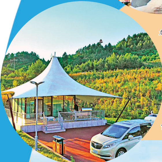
“设施完备的 汽车营地。”