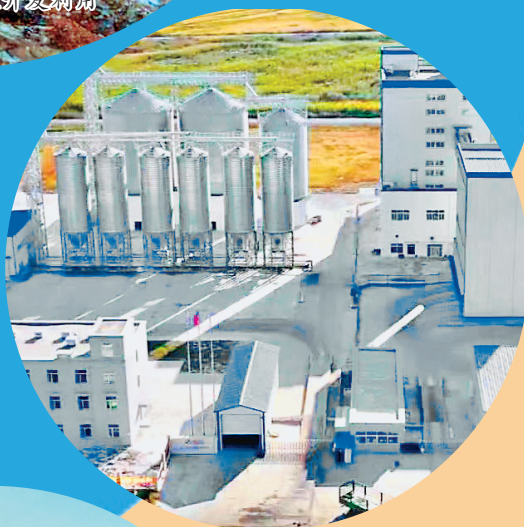
↑铁力市金新农饲料加工车间。