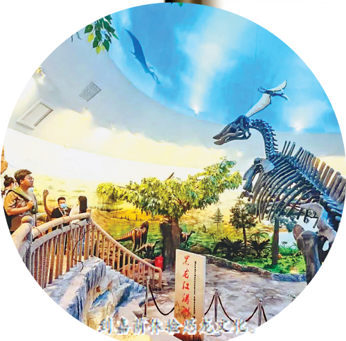
恐龙化石展览文化。