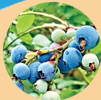
加快“伊春蓝莓”农产品 地理标志品牌培育推广。