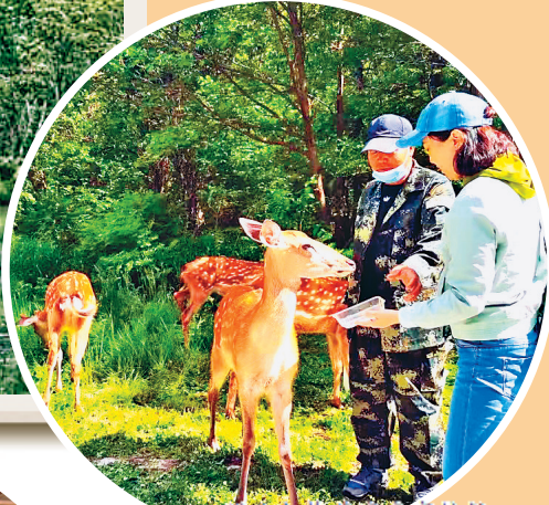
伊春公司与花鹿亲密接触。