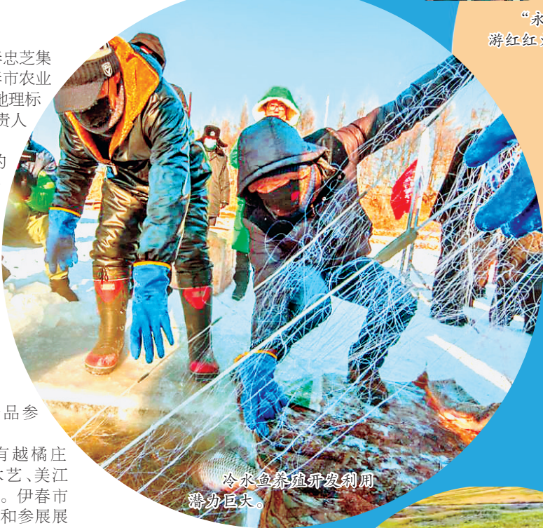
冷水鱼养殖循环利用 动力巨大。