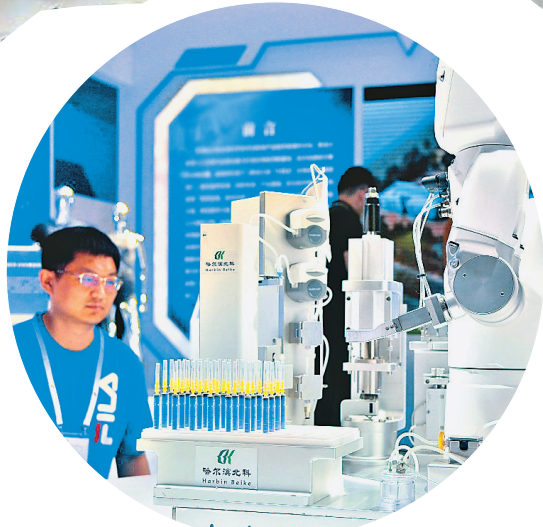
全自动细胞分装平台。