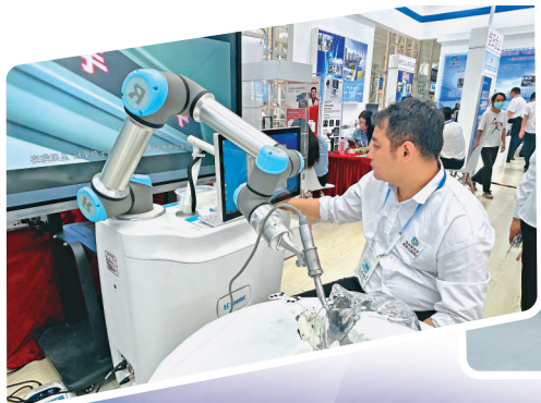
工作人员操作种植机器人。

工作人员告诉记者，这款智能心电衣操作简便，可用于术后疗效评估、危险期管理，心电数据可实时传输、远程传输、减少恶性心脏事件的发生。