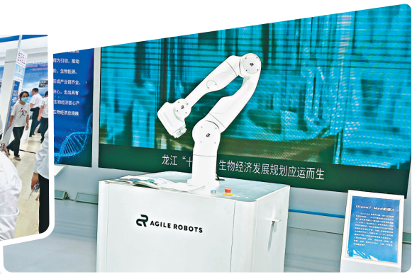
用于骨科手术的机器人。