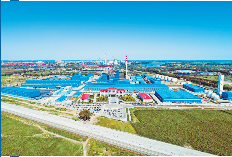
黑龙江紫金铜业厂区。