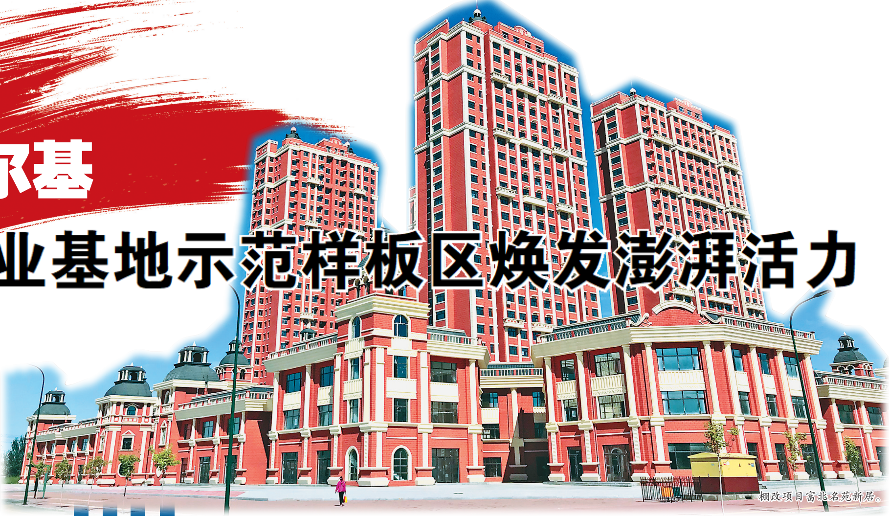
棚改项目富北名苑新居。