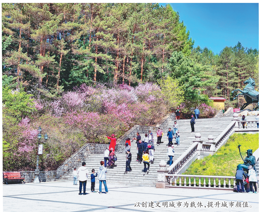
以创建文明城市为载体,提升城市颜值。

2017年,伊春市荣获第五届“全国文明城市”称号;2021年,伊春市蝉联第六届“全国文明城市”称号。伊春市还被授予全国仅有的5个、中国北方第一个“中国天然氧吧城市”称号,连续三次获评国家卫生城市,第三次捧回全国综治平安建设最高荣誉“长安杯”。