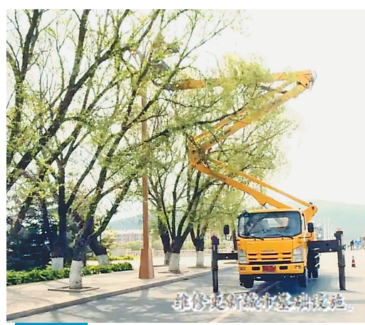
推进城市基础设施。