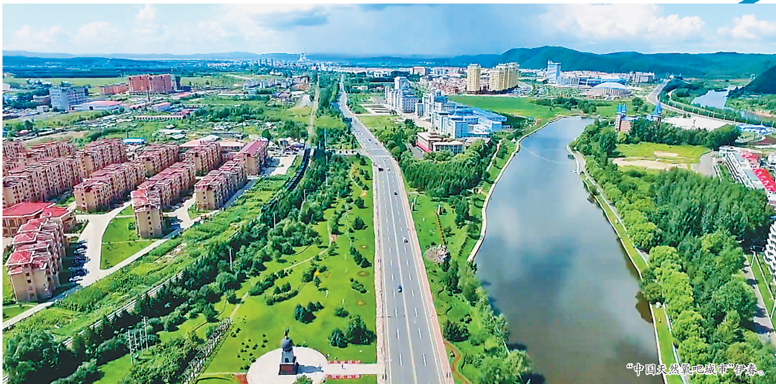
“中国天然氧吧城市”伊春。

2017年伊春市成功摘得第五届“全国文明城市”桂冠,2021年伊春市蝉联第六届“全国文明城市”。矢志不移15载,文明创建再启程。伊春市委书记隋洪波说:“今年适逢第七届全国文明城市‘大考’之年,伊春市将全面对标全国和省测评体系,充分用好‘四个体系’闭环工作落实机制,锚定目标、真抓实干,奋力夺取全国文明城市‘三连冠’,争创全国文明城市典范城市。”