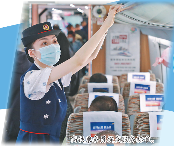
高铁乘务员提高服务标准。