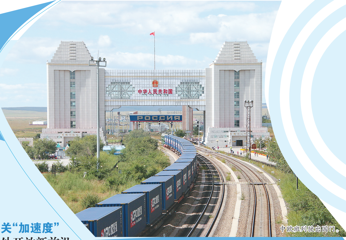
中欧班列驶出国门。