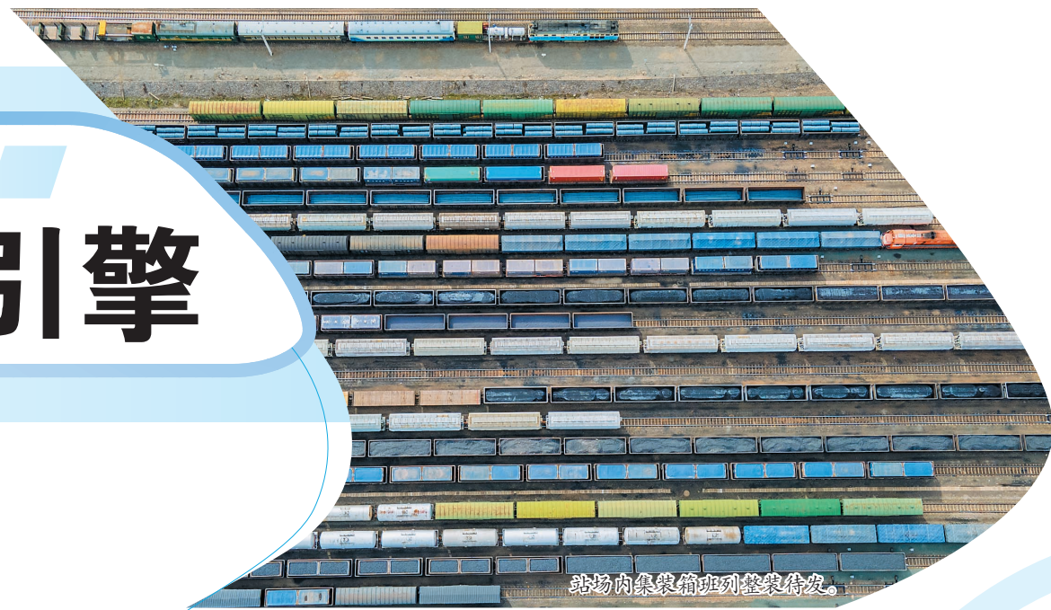
站场内集装箱班列整装待发。