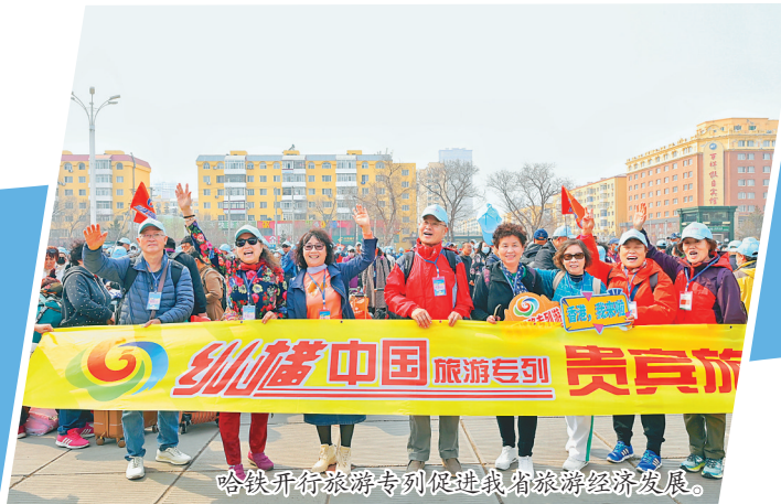
哈铁开行旅游专列促进我省旅游经济发展。

学习贯彻习近平新时代中国特色社会主义思想主题教育开展以来,哈尔滨局集团有限公司深入贯彻落实习近平总书记对东北地区重要指示精神,以服务黑龙江省经济发展为己任,持续完善路网结构,推进客货运输供给侧结构性改革,降低物流成本,提高百姓出行品质,畅通口岸通道,助推“一带一路”建设,勇当服务和支撑中国式现代化“火车头”,为黑龙江省全面振兴全方位振兴注入新动能。