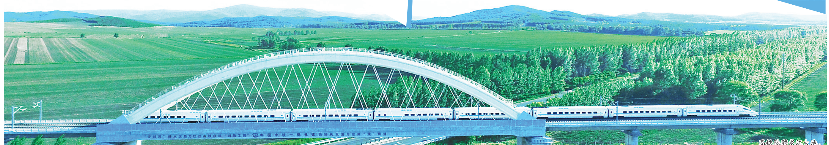
高铁驰骋龙江大地。