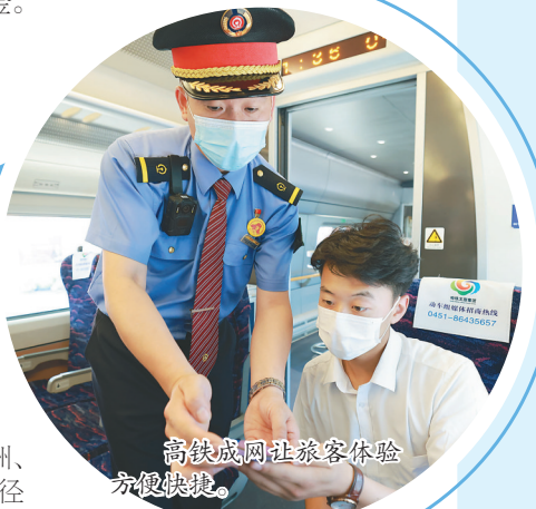
高铁成网让旅客体验方便快捷。

哈尔滨局集团有限公司开展“百趟专列进龙江”项目,在国铁集团的支持下,与成都、郑州等铁路部门合作开展旅游新项目,提升省内外旅游市场热度,让黑龙江绿水青山持续生金。