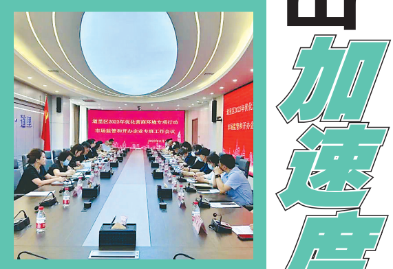
召开优化营商环境专题会。

围绕建设“六个龙江”、推进“八个振兴”和哈尔滨市打造“七大都市”,今年年初,道里区启动实施招商引资竞赛年、项目建设落实年、消费复苏促进年和实体经济服务年活动,充分发挥在扩大内需、产业布局中的骨干作用,努力成为全市振兴发展排头兵、当骨干、作贡献。