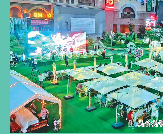
美食美景释放消费活力。