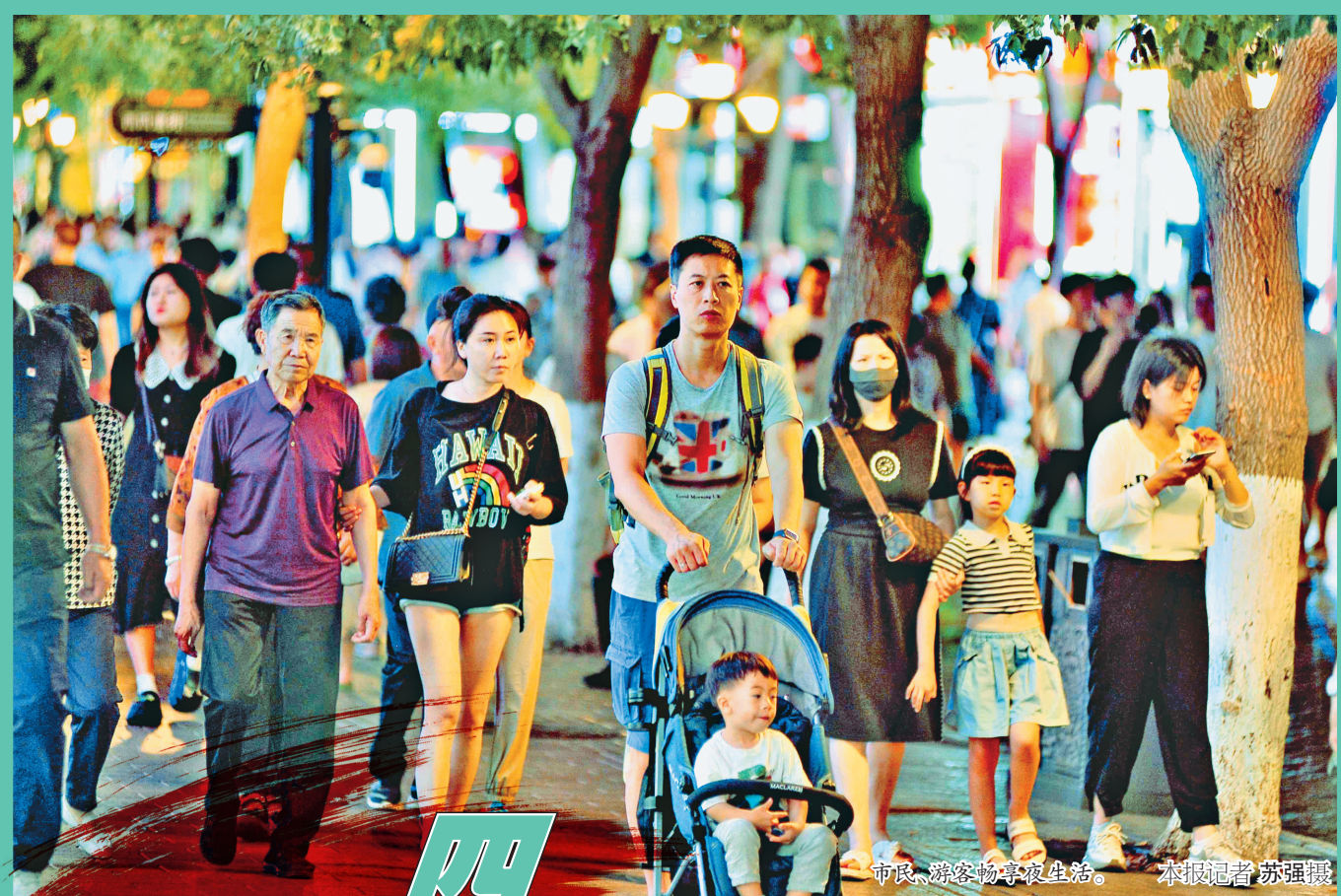
市民、游客畅享夜生活。本报记者 苏强摄

当前,哈市已进入汛期。道外区将按照“防大汛、抗大险、救大灾”要求,统筹防、突出救,全力以赴打好防汛抗洪主动仗;加强部门合作,时刻掌握动态变化,根据实际情况及全市总体部署启动应急响应,科学有效处置应对;以深化能力作风建设“工作落实年”活动为牵引,强化责任意识和使命担当,狠抓工作落实,全力做好今年河湖长制和防汛抗洪各项工作,确保道外区河湖、水清、岸绿、景美,确保安全度汛。