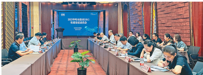
轻症患者多的病组权重适当降低。通过论证,专家组对372个病组提出了调整意见,其中上调108组,下调264组。此次DRG权重论证会坚持科学性和

时效性相结合,合理安排专业分组协商,提高了沟通协商效率;坚持代表性和权威性相结合,全领域多层次遴选协商专家,确定了24家医疗机构,43个专业方向的96名专家参与论证;坚持公开、公平、公正,统一培训,统一标准,统一原则,全程规范协商。下一步,哈市医保局将不断扩充专家队伍、丰富论证经验、优化论证工具,进一步优化和完善病组分组,配套相关政策,通过DRG支付方式改革持续提升医保基金治理水平,规范医疗服务行为,控制医疗费用不合理增长,更好地保障参保人员权益。