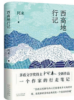
《西高地行记》阿来著 北京十月文艺出版社 2023年6月

阿来曾说，行走与写作是他的宿命，于是有了这部行走笔记。从四川到西藏、云南、贵州、甘肃……阿来写大地、星光、山口、银环蛇、野人、鱼、马、群山和声音，去除了多余的神秘，但又不忘记读者引向广阔的精神空间。