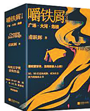
《嚼铁屑》曹跃辉著 江苏凤凰文艺出版社 2023年7月

阿来曾说，行走与写作是他的宿命，于是有了这部行走笔记。从四川到西藏、云南、贵州、甘肃……阿来写大地、星光、山口、银环蛇、野人、鱼、马、群山和声音，去除了多余的神秘，但又不忘记读者引向广阔的精神空间。