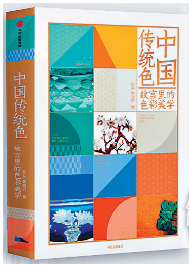
《中国传统色：故宫里的色彩美学》/郭浩 李健明/中信出版社/2020年9月

提起故宫，我脑海里瞬间浮现出了北京城里那一栋栋红墙黄瓦的建筑。明黄色的琉璃瓦在太阳的照耀下熠熠生光，一眼便让人感受到了不怒而威的气势，威严、雄伟、富贵。琉璃瓦下是一排排朱红色的宫墙，树影婆娑在墙上随风而动，好像有说不尽的故事。于是，关于故宫的印象便从这两种颜色开始生发。