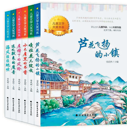
《儿童文学大奖书系》/北方文艺出版社/2022年8月

阅读提供了一种看见世界和丰富自我的方式。我们希望孩子拥有充实的、友爱的、快乐的、有梦想的童年，希望引导孩子将共情、理解、尊重根植于内心，与同龄人建立情感联结，阅读提供了这样的机会。阅读让孩子走进其他人的生活，引导孩子表达自我的意愿。“读者是培养出来的，不是天生的。”在这套书中，文本赏析能够帮助孩子学会如何与文本交流并享受其中的乐趣。这套《儿童文学大奖书系》可以作为孩子打开文学世界的敲门砖，起到激发阅读兴趣、陶冶文学情操、提升文学素养的作用。