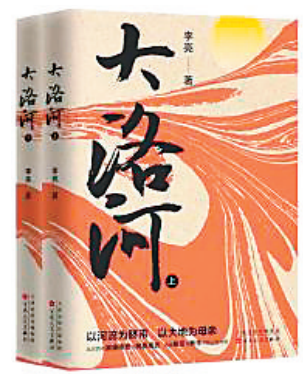
《大洛河(上下)》李亮著 百花文艺出版社 2023年8月

《大洛河》是一部横跨十九世纪至二十一世纪的现实主义题材长篇小说，讲述了宗家五代人在不同历史环境下的命运。书中还展现了丰富的陕北传统民俗文化和民间美术艺术，如饮食、民歌、说书、服饰、婚俗、剪纸、刺绣等。