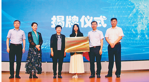
黑龙江省智慧医学影像产业技术创新联盟揭牌。

本报讯(记者彭溢)近日,黑龙江省智慧医学影像产业技术创新联盟成立大会暨“汇智龙江”科技成果路演推介对接系列活动在哈尔滨举办,标志着黑龙江省智慧医学影像产学研用深度融合发展迈上新台阶。