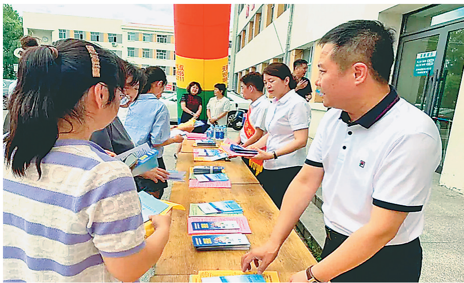
工作人员向办事群众讲解医疗保险政策。

门诊待遇保障方面,《通知》指出,继续提高“两病”门诊费用支付比例。其中,普通门诊统筹起付标准不低于50元,年度最高支付限额不低于200元。明年1月1日起,“两病”参保人员在一级及以下基层医疗机构、二级医疗机构门诊医疗费用支付比例分别提高到80%和70%。同时鼓励有条件的市(地)逐步将门诊用药保障机制覆盖范围从高血压、糖尿病扩大到心脑血管疾病。