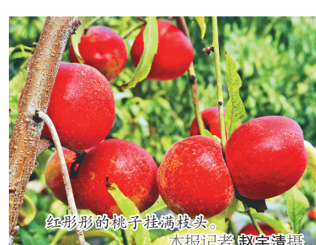
红彤彤的桃子挂满枝头。

本报讯(刘雪莹 记者赵宇清)八月正是油桃丰收的季节,近日新兴区红旗镇红胜村寒地油桃采摘节在鞭炮声和掌声中拉开帷幕,洋溢着喜悦、香甜脆爽的寒地油桃成为节日的主角。