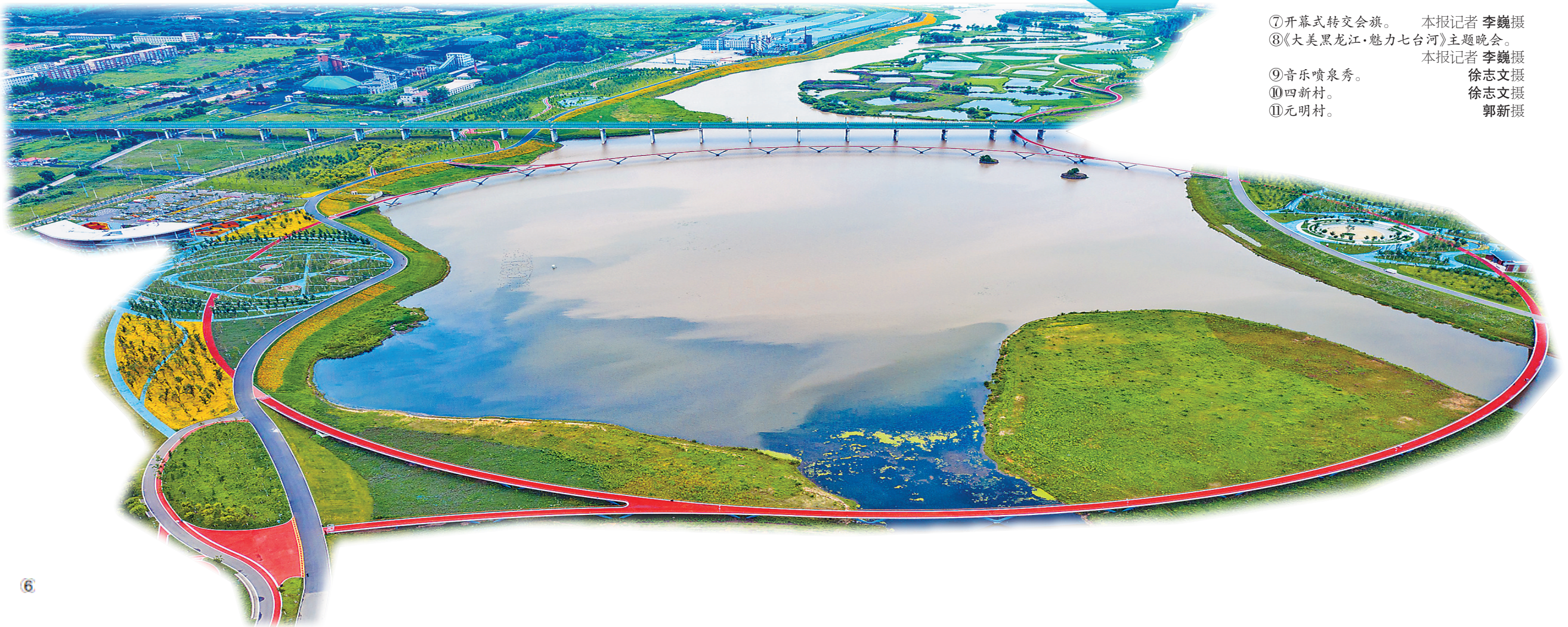
⑦开幕式转交会旗。本报记者李巍摄 ⑧《大美黑龙江·魅力七台河》主题晚会。本报记者李巍摄 ⑨音乐喷泉秀。徐志文摄 ⑩四新村。徐志文摄 ⑪元明村。郭新摄