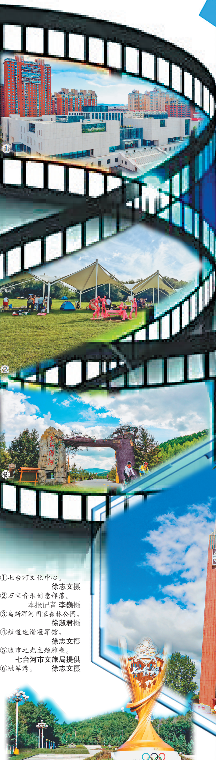
①七台河文化中心。徐志文摄 ②万宝音乐创意部落。本报记者李巍摄 ③乌斯浑河国家森林公园。徐淑君摄 ④短道速滑冠军馆。徐志文摄 ⑤城市之光主题雕塑。七台河市文旅局提供 ⑥冠军湾。徐志文摄