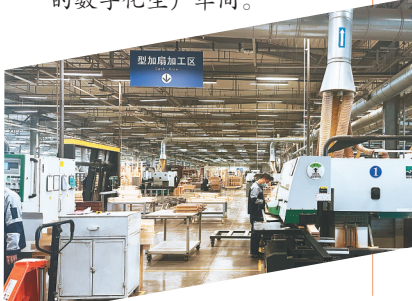
森鹰窗业股份有限公司自动化生产车间里正在进行加工作业。

新的发展蓝图获得广泛认可。22个产业专班先后成立，产业规划、政策相继出台。与此同时，黑龙江促进产业振兴、推动东北全面振兴全方位振兴取得新突破的“工具箱”不断出招。工业振兴、科技、旅游、外贸、外资……全省陆续出台32项产业振兴发展政策；发布《新时代龙江人才振兴60条》；出台50条“硬核”措施，全力以赴稳住经济基本盘；在春节前夕，发布了20条政策措施，拿出真金白银，提振市场信心，增强发展预期，推动经济全面复苏。