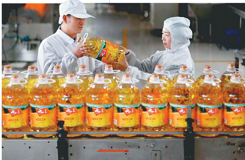
九三食品股份有限公司自动生产线。

无中生有，有中生新。按照习近平总书记做好“三篇大文章”的重要指示，黑龙江高质量构建起“4567”现代产业体系，力争到2026年，三次产业结构实现优化升级，二产增加值占GDP比重达到1/3以上的产业振兴梦想，正照进现实。