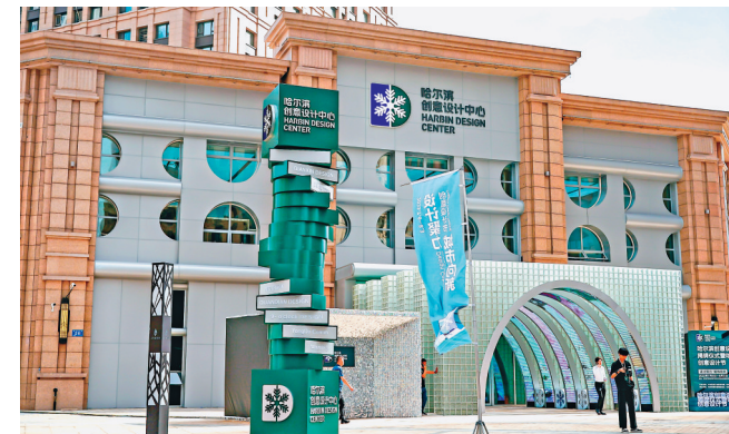
哈尔滨创意设计中心外景。