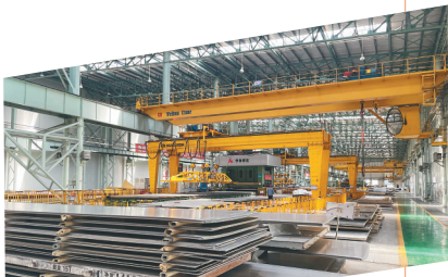
东北轻合金有限责任公司的数字化生产车间。