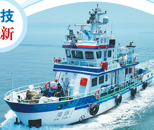
哈尔滨工程大学联合研制我国首艘教学学生智能科研试验船“海研1”首航。