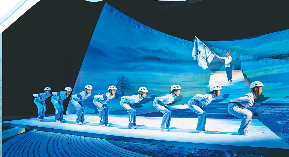
京剧《冰道》上演引起热烈反响。