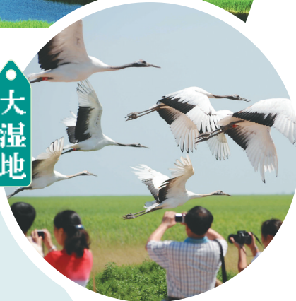
在扎龙湿地,人与丹顶鹤和谐共处。