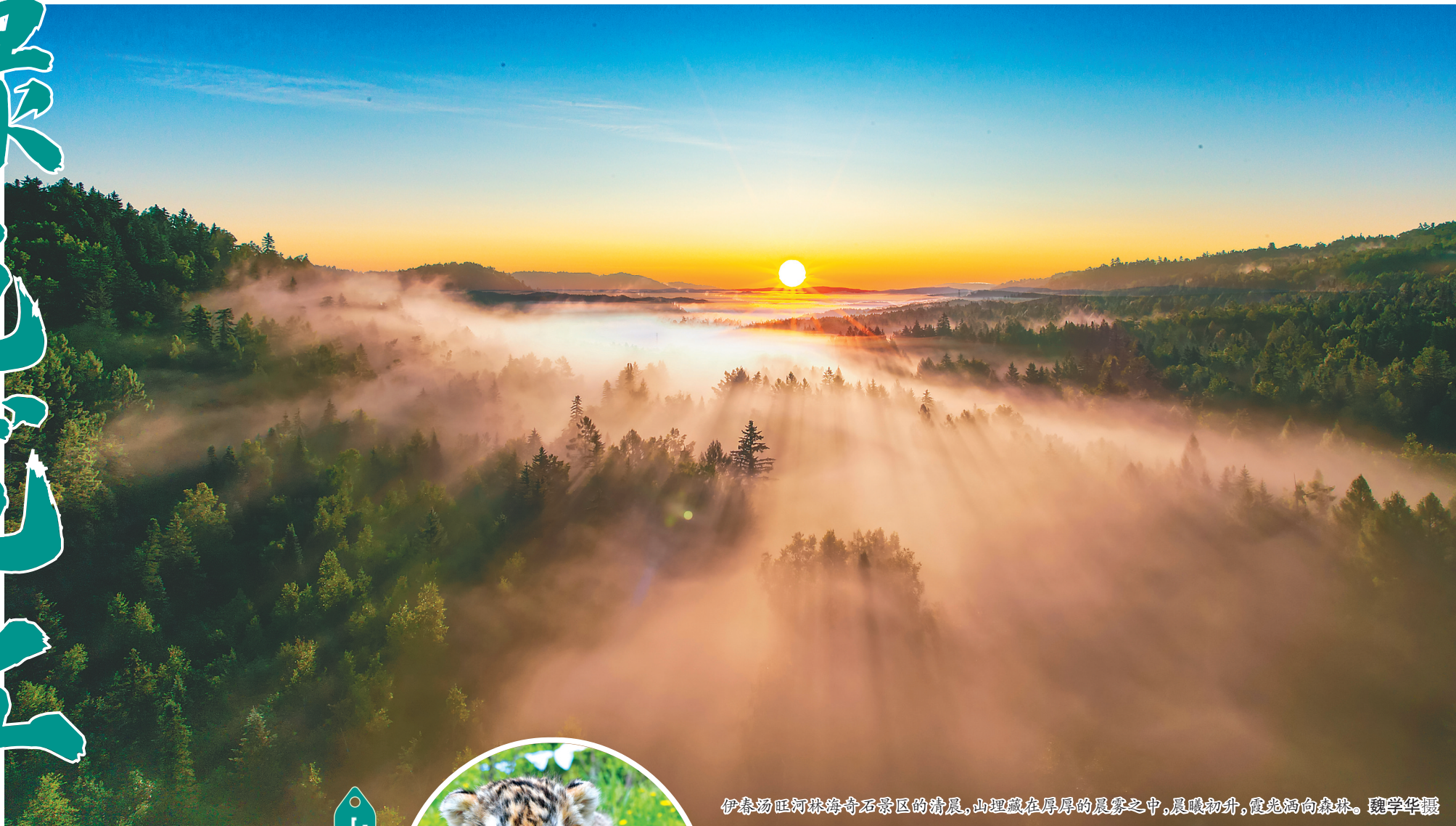
伊春汤旺河林海奇石景区的清晨,山峦藏在厚厚的晨雾之中,晨曦初升,霞光洒向森林。