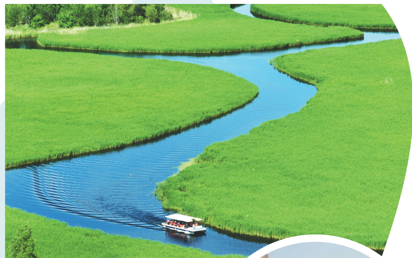
守好蓝天碧水净土,绘就美丽龙江新画卷。图为扎龙湿地。

黑龙江省是湿地大省,湿地面积大、类型多、生态区位重要。第三次全国国土调查数据显示,全省湿地面积516万公顷,主要分布在大兴安岭、小兴安岭、三江平原和松嫩平原。建有国际重要湿地12处,数量居全国之首,哈尔滨市首批荣获全球“国际湿地城市”称号。已建立国家级湿地类型自然保护区20处,省级湿地类型自然保护区53处,国家湿地公园63处,省级湿地公园12处。