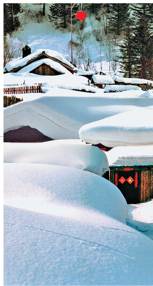
雪乡凭借独特的美景成为人气超高的冬季旅游目的地。龙头采客 肖殿昌摄

冰雪大世界、中央大街、伏尔加庄园、雪乡、亚布力、北极村,马迭尔冰棍、冰屋火锅、冰糖葫芦、锅包肉、大列巴、黏豆包,千人冰壶挑战、冰河冬泳、雪地温泉、雪中观鹤、泼雪节、冬捕季……每到冬季,黑龙江都会因各种极具特色的冰雪主题频频登上热搜,愈冷愈“热”。