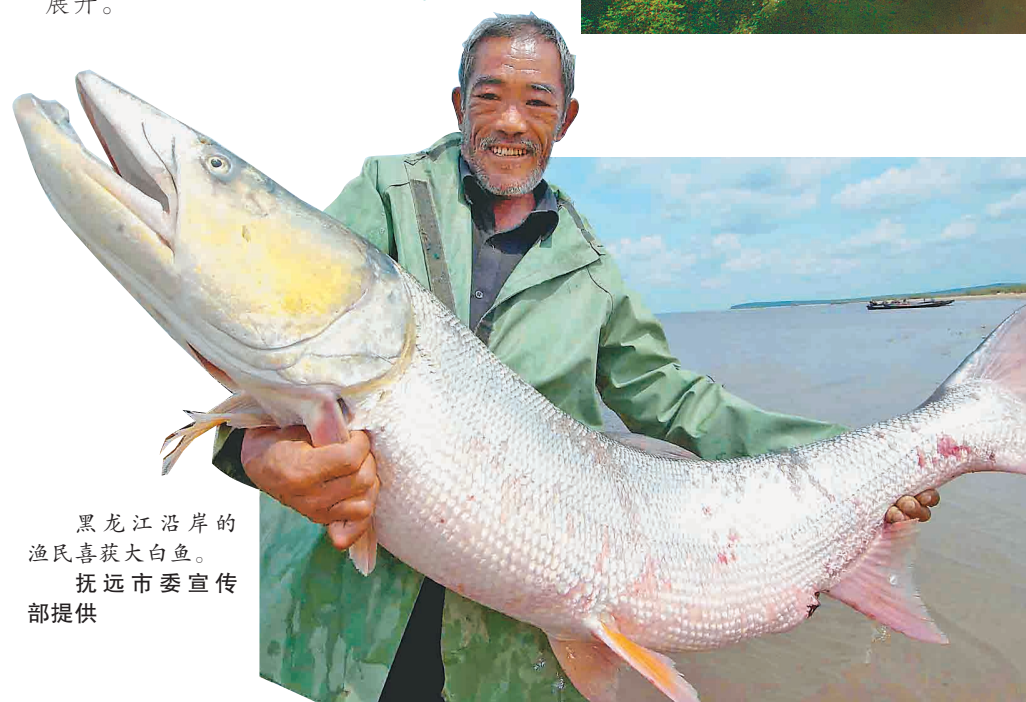
黑龙江沿岸的渔民喜获大白鱼。抚远市委宣传部提供