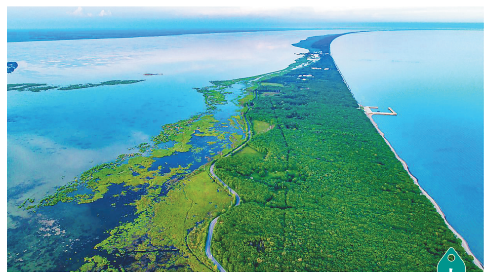
全省现有兴凯湖、镜泊湖、连环湖和五大连池四处较大湖泊及星罗棋布的湖泊640个,常年水面面积1平方公里及以上湖泊253个。美丽的兴凯湖,碧水清波势如海,绵延百里黄金沙。本报资料片