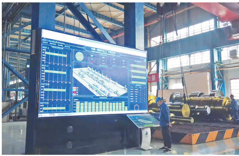
中国一重生产车间内的电子大屏。

中国一重铸钢事业部炼钢厂网络覆盖率达到90%以上,建立了设备之间的工业通信网络,实现了质量全流程监控、生产可视化和冶炼数据积累。这