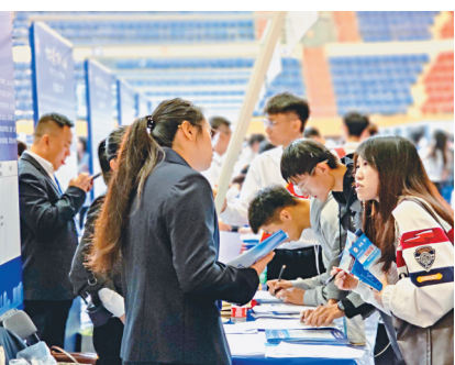
□文/摄 林萃 李承晏 本报记者 邢汉夫

用好用活“促”字诀,深入调查研究不放松。工作专班邀请专家对如何开展调研工作进行针对性指导。同时组织开展征文活动,聚焦新时党的建设战略性、前瞻性课题,确定3个主课题和14个子课题,累计征集研究课题124个。督促各级领导班子成员带头深入基层一线察实情、研实招、求实效,围绕制约振兴发展、阻碍工作落实、群众“急难愁盼”等突出问题,推动调研工作走深走实。