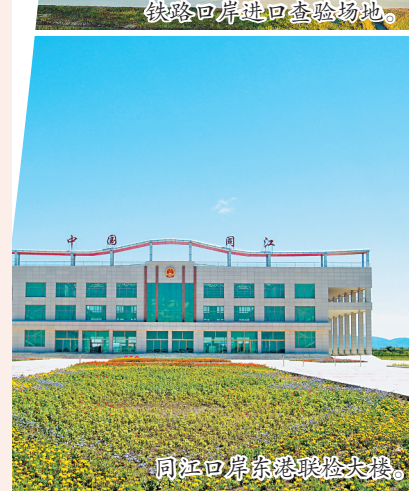
同江口岸东察路查验大楼。