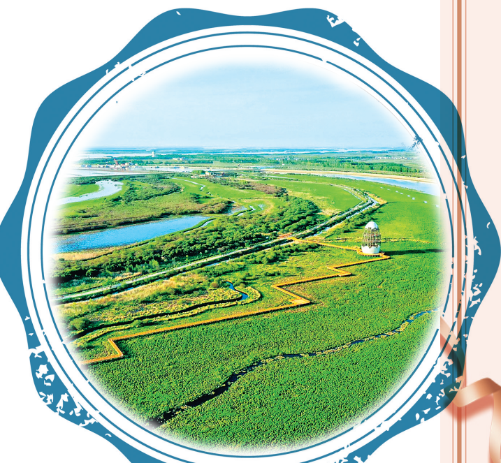
同江三江口国家湿地公园。