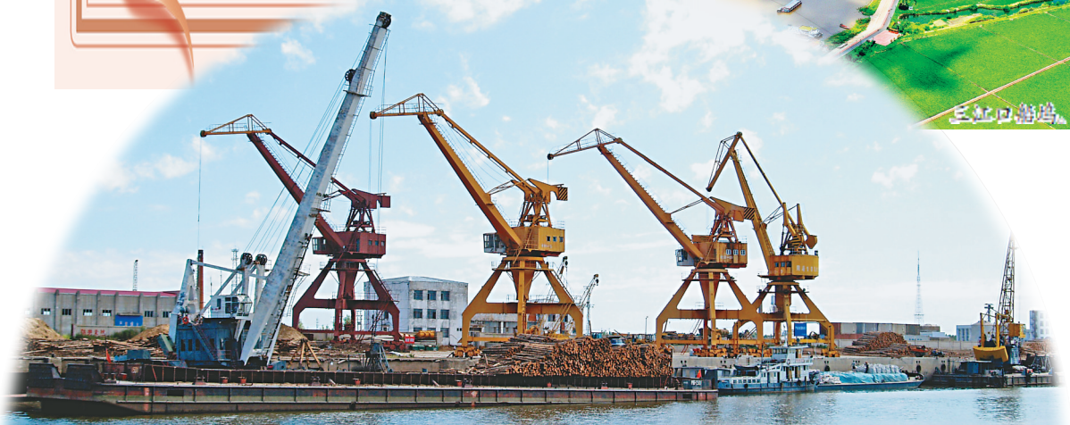
同江口岸西部作业区。