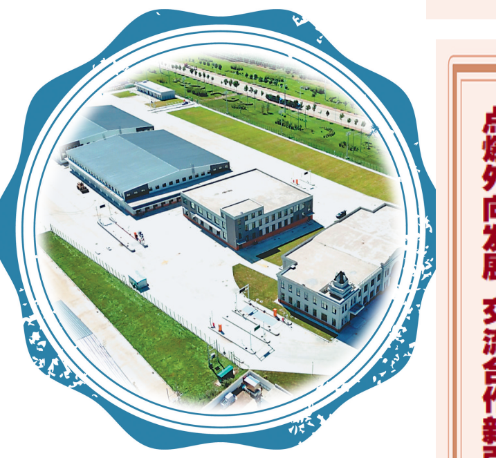
同江市中俄铁路边民互市贸易点项目。