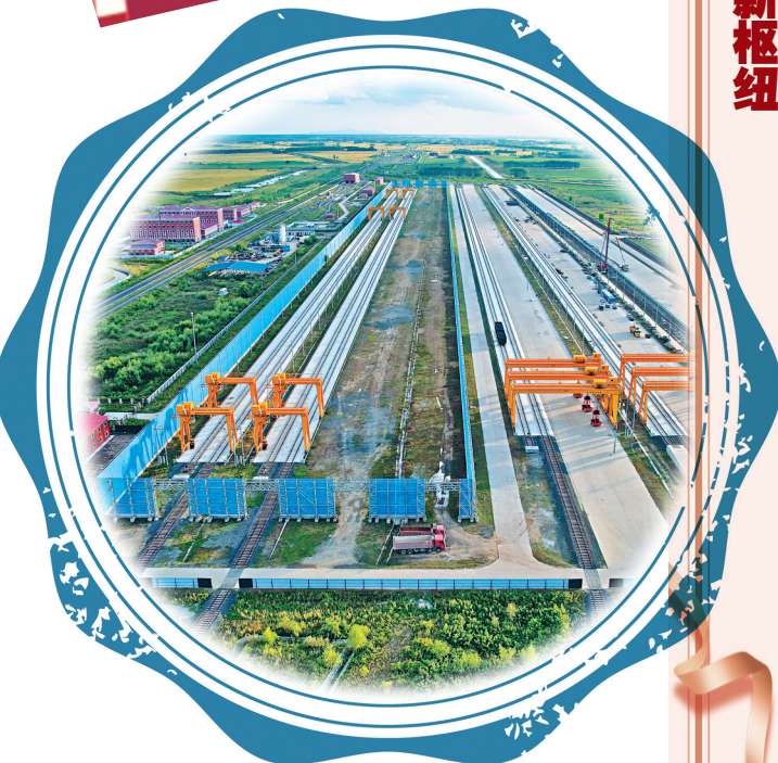
铁路口岸换装站场。