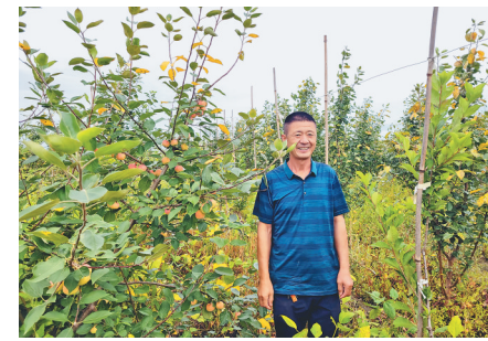
□文/摄 朱建文 胡春风 本报记者 白云峰

秋高气爽,依兰县三道岗镇三道岗村果园的龙丰果树迎来结果期。放眼望去,橘黄色的成熟龙丰果已经挂满枝头,在绿油油的叶子映衬下,显得格外诱人。摘下一颗龙丰果咬在嘴里,酸甜的果汁瞬间溢满口中。