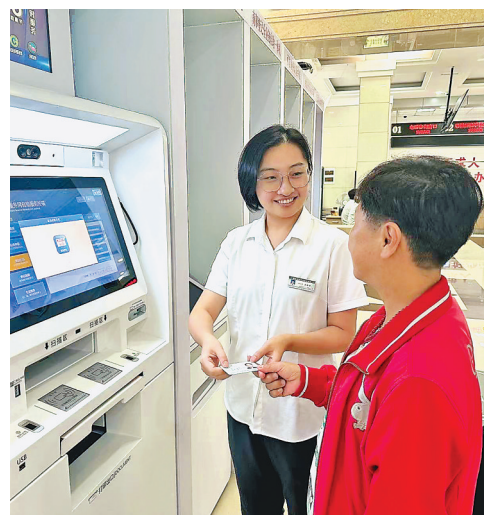
工作人员指导市民办理业务。

本报讯(记者马智博)记者从哈尔滨市营商环境建设监督局了解到,在今年上半年全省优化营商环境专项考核中,哈尔滨总成绩排名第一。按照《哈尔滨市2023年优化营商环境专项行动实施方案》,年初至今,该局已推出320项改革举措,营商环境持续优化。