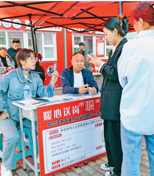
2023中国制博会人才发展论坛对话现场。

新区职业指导工作室以新区产业为依托,深化产教融合,加强校企合作,今年6月,工作室联合黑龙江职业学院成立“龙职基地”,开创数字产业人才储备、培养新模式。截至目前,哈尔滨新区职业指导工作室共举行定制化“菜单式”职业指导培训讲座26期;促进校企合作34家,建立实习实训基地14个;提供就业岗位超过6万个,为企业引进人才超7000人。