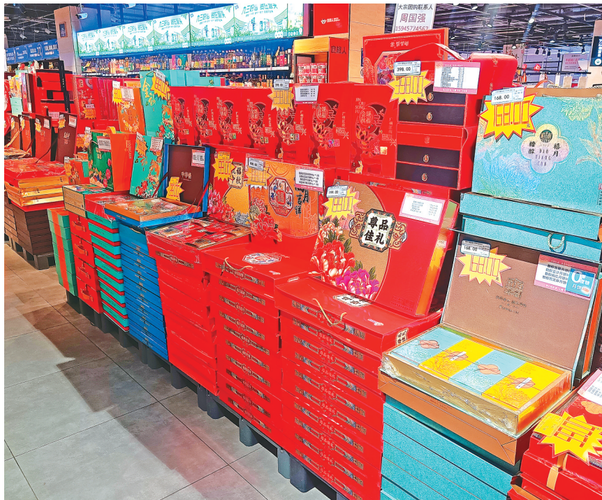
低糖月饼自成一派。