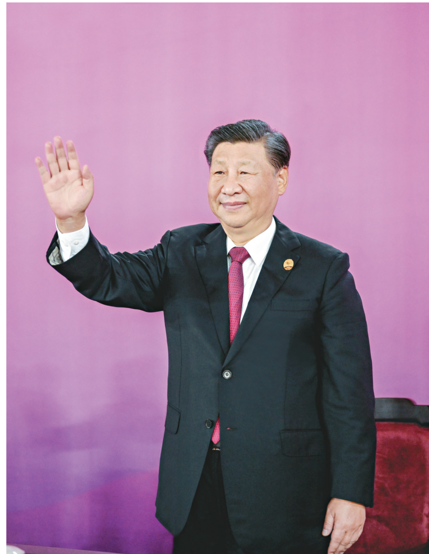
9月23日晚,第十九届亚洲运动会在浙江省杭州市隆重开幕。这是国家主席习近平在主席台上向大家挥手致意。