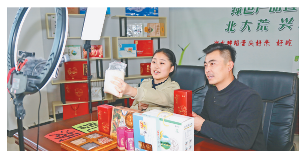
带货主播为网友介绍兴凯湖分公司农副产品。

本报讯(韩宝华 李淑霞 记者刘畅)中秋国庆临近,北大荒农业股份兴凯湖分公司的绿色产品直播间内一派繁忙的景象,带货主播耐心细致地为粉丝们讲解特色农副产品,一边的后台运营管理人员配合做好服务工作,成功交易订单不断增加。自今年的新米上市以来,分公司生产的系列新米就受到了众多新老客商的青睐,每日交易量持续攀升,呈现出产销两旺的良好势头。