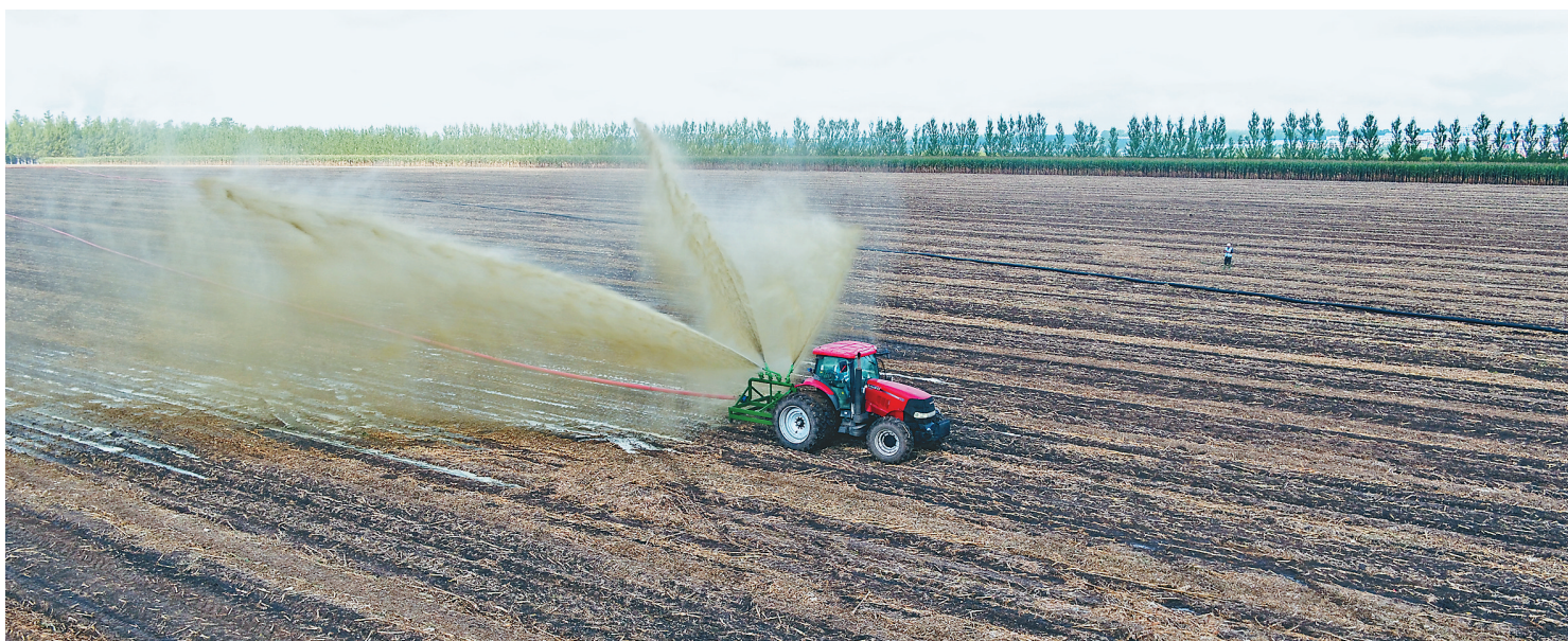
鹤山农场有限公司粪肥还田现场。

从2020年开始,为解决坡耕地“跑水、跑肥、跑土”导致的粮食低产和生态破坏难题,红兴隆分公司与中国科学院“黑土粮仓”科技会战三江项目合作,汇集国内农业、土壤、遥感、水肥等方面专家,在友谊农场开展了“等高环播”种植模式实验。这种集成探地雷达、草水路、变量施肥、变量喷药等13项技术构建形成的以3000亩为尺度的小流域黑土地保护与智慧农业融合发展模式效果明显,取得了地表径流量降低60%以上,土壤流失量降低80%以上,化肥施用量减少