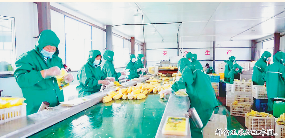
鲜食玉米加工车间。

据介绍,目前,加工厂每天可加工鲜食玉米5万到5.5万穗,年加工量60万穗,提供80个固定的就业岗位,并探索出“企业+农户”的致富模式,依托本村的玉米加工,实现村民在本村就业。仅种植糯玉米一项,周边农户每亩土地增收3000多元,带动周边村民受益。