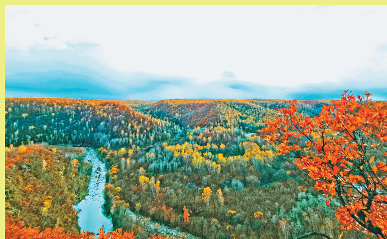
锦河大峡谷景观一角。