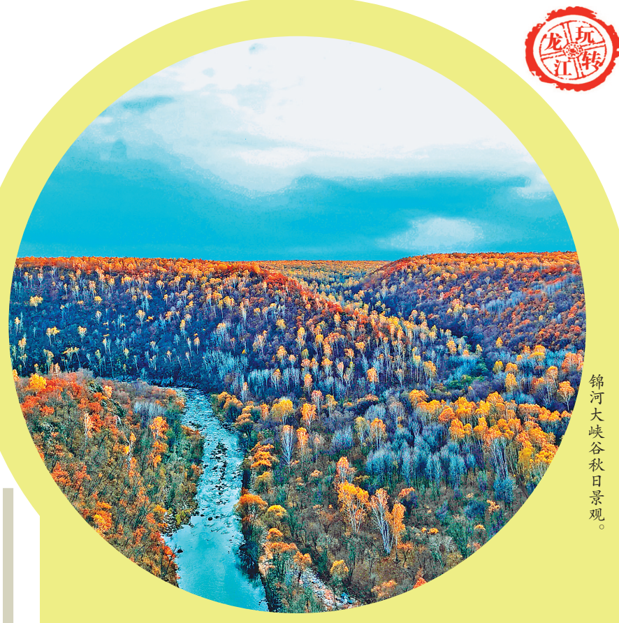
锦河大峡谷秋日景观。