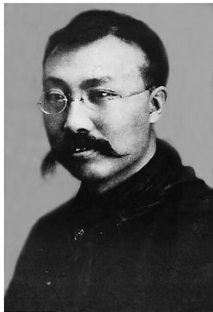
李大钊1924年参加共产国际会议时留影。