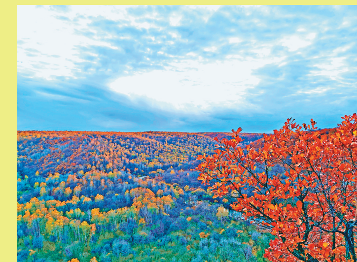
航拍锦河大峡谷景观。